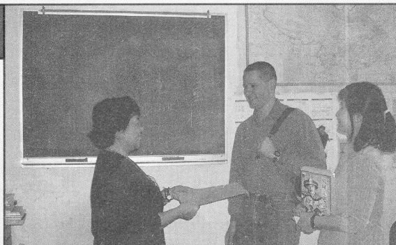
Greetings are common in many different situations.