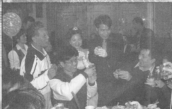
Chinese people use both hands when making a toast.